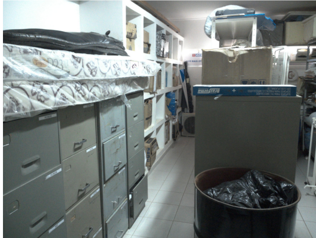
22.13. Depósito onde também armazena-se os prontuários médicos