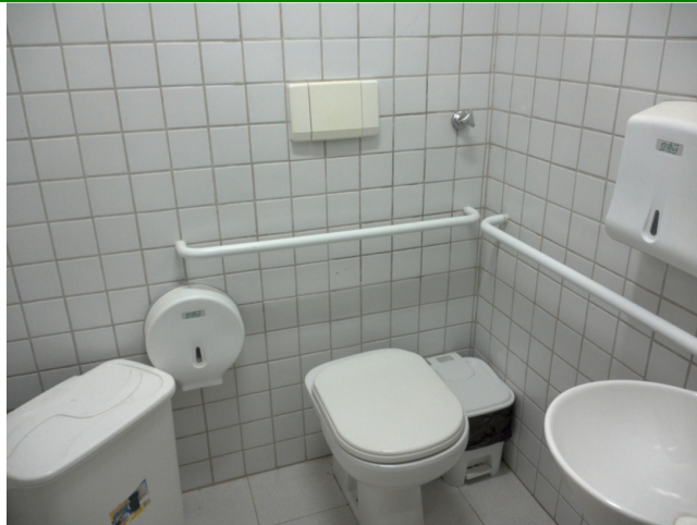
22.8. Sanitários adaptados para os portadores de necessidades especiais (PNE)