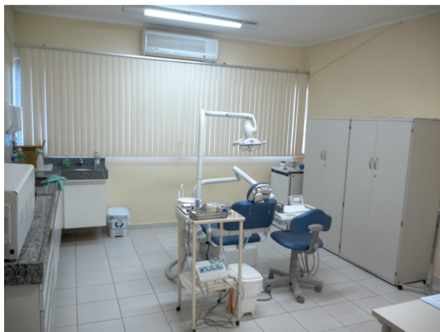
22.9. Consultório Odontológico