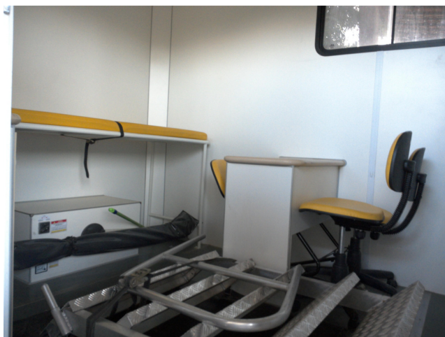
22.11. Unidade móvel - parte interna que em algumas ocasiões é utilizada como consultório médico - observar que não conta com pia