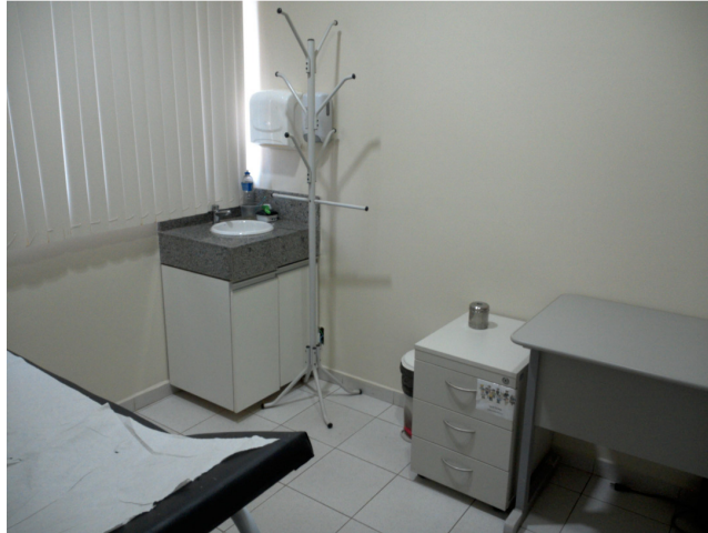
22.3. Consultório médico - foto 2