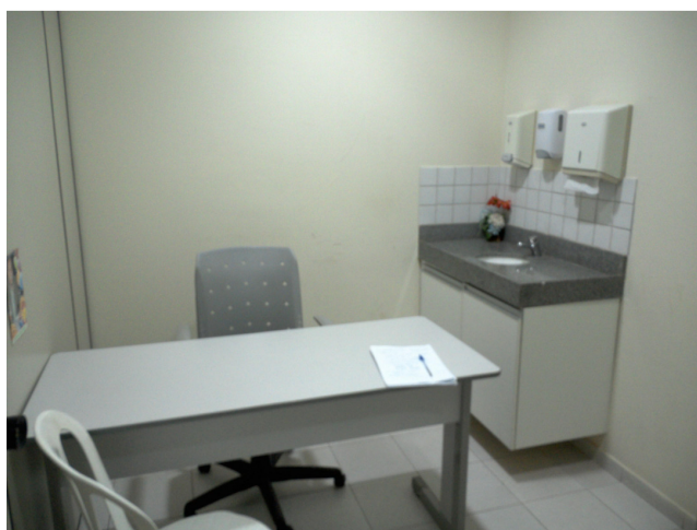
22.2. Consultório médico - foto 1