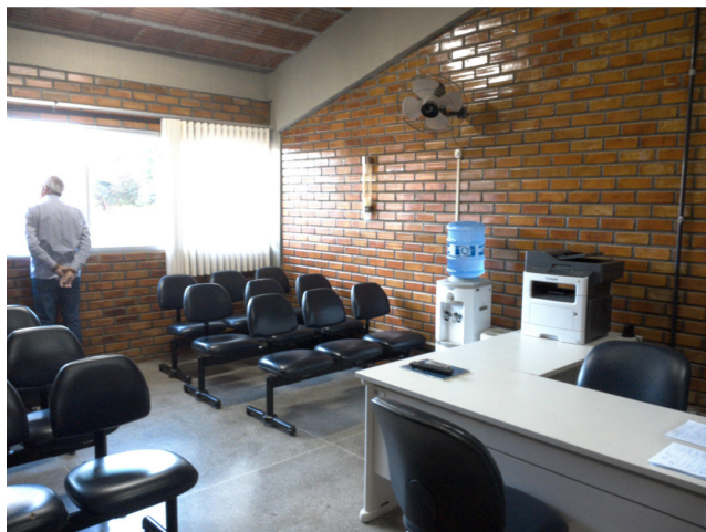
22.1. Recepção e sala de espera