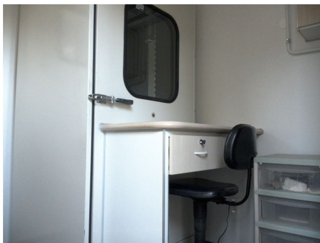
22.12. Unidade móvel - foto interna