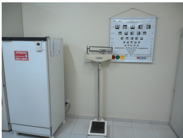
22.6. Sala de saúde ocupacional - foto 2