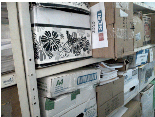
22.14. Guarda de prontuários médicos