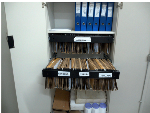
22.4. O local de guarda do prontuário de cada empresa do ano corrente