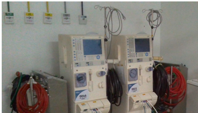
15.5. Central de hemodiálise