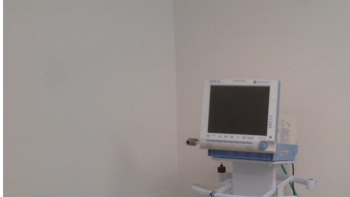
15.4. Sala de estabilização (foto 2)