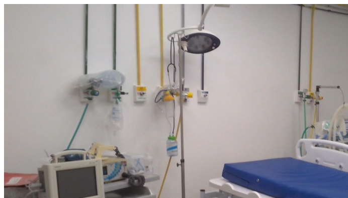
15.3. Sala de estabilização (foto 1)