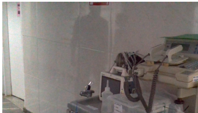
15.2. Carrinho de parada das enfermarias